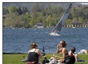
Hitze und starker Wind am Samstag in Zürich.

Dem Föhn sei Dank: Heute gabs nördlich der Alpen ein Hitzetag. Das gabs im April noch nie. Vielleicht klappts auch mit einer Tropennacht. Und der Saharastaub brachte schöne Sonnenuntergänge.